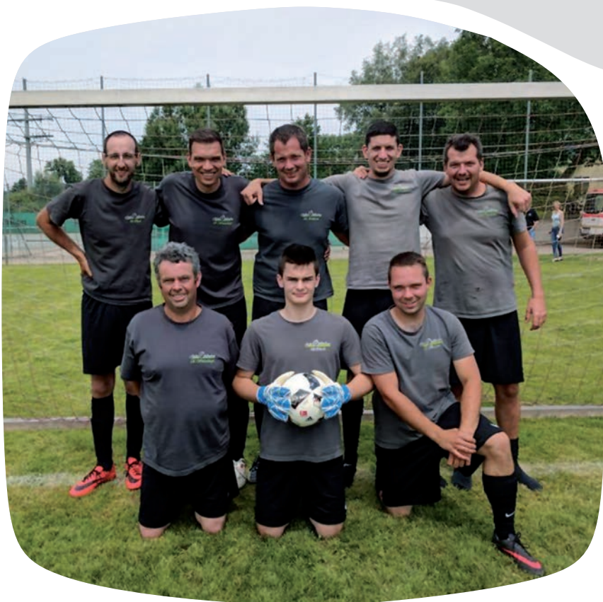
Grümpelturnier in Wollbach

Ob beim Fußball, Laufen, Go-Kart fahren oder auch einfach nur ein Fest gemeinsam erleben! Wir sind gerne in Bewegung und genießen immer wieder mal außerhalb der Arbeit mit unserem Team eine gemeinsame und lustige Zeit zusammen.